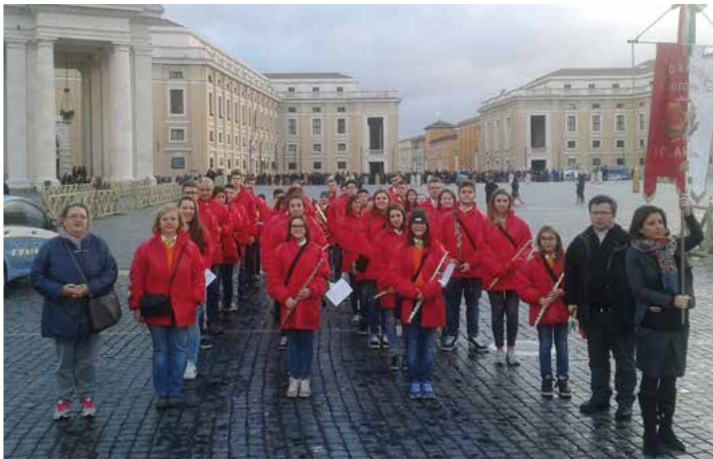
La Banda di Solarolo in piazza San Pietro a Roma

ristici che da ultimo hanno colpito Parigi, fanno davvero riflettere e portano tutti noi a cercare qualcosa che, nonostante tutto, ci renda più forti di fronte a questo clima di terrore; qualcosa che ci renda immuni davanti a chi usa violenza e armi come pane quotidiano, uno strumento pacifico di confronto (se confronto si può definire). Beh, noi musicisti quel qualcosa lo abbiamo trovato: è la nostra musica.