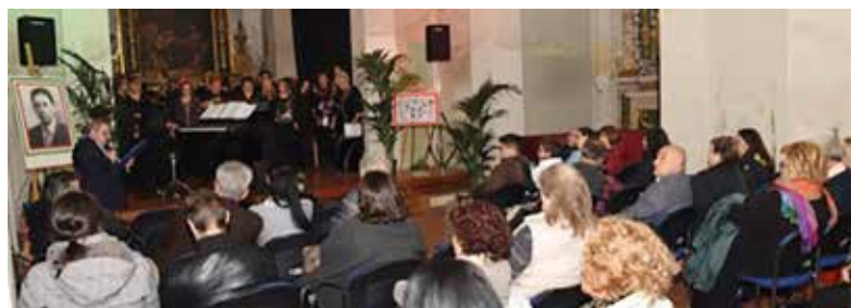
Una fase del Concerto con vista parziale del pubblico da tergo