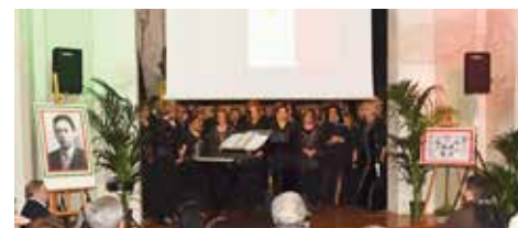
La sceneggiatura ed "ouverture" del Concerto, con il Logo dell'ANPI di Solarolo ed il canto del "Va' pensiero" di Giuseppe Verdi eseguito dal Gruppo Corale "A. Corelli" di Fusignano