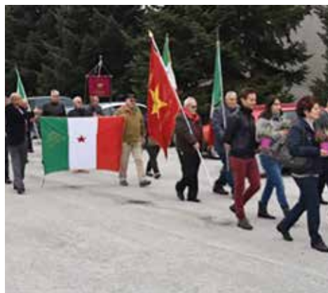
Panoramica sulla parte centrale del corteo al Cimitero della Madonna della Salute

Una giornata indimenticabile quella del 18 ottobre 2015. La Sezione ANPI di Solarolo patrocinata dal COMUNE DI SOLAROLO, in occasione del 71° Anniversario del Sacrificio di TEODOSIO TONI il Partigiano Solarolese «Tigre», ha voluto degnamente concludere l'anno del 70° dalla Liberazione del nostro paese e dell'Italia intera dal giogo nazi-fascista, rendendo "memoria" ed "onore" a tutti i volontari solarolesi caduti combattendo. Inoltre onorando anche tutti coloro che hanno contribuito quali Perseguitati Politici Antifascisti, Internati Militari in Germania, Patrioti e Partigiani combattenti, (inclusi anche tutti coloro che rimasti nell'anonimato li ospitarono, li cibarono e vestirono,