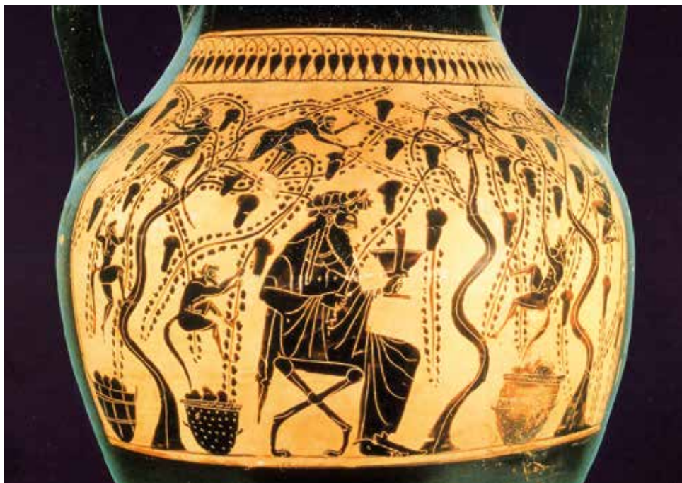
Il pittore di Priamo (VI sec. a.C.), particolare da anfora attica a figure nere. Museo Valle Giulia, Roma