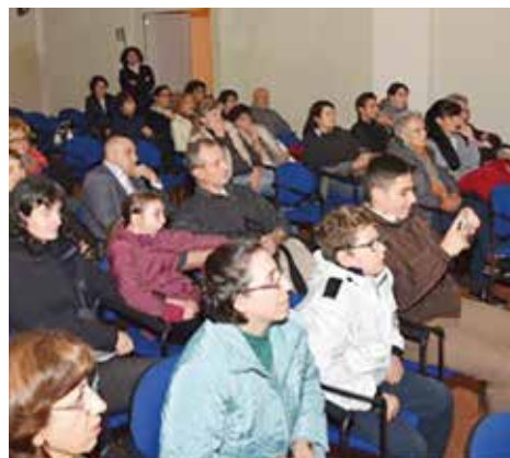
Panoramica parziale del pubblico presente