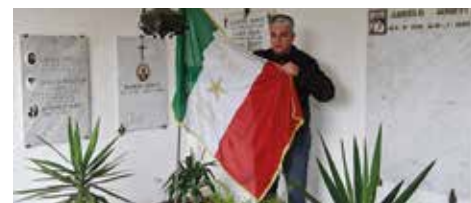
L'omaggio floreale della delegazione ANPI sulla tomba ove riposano la martire LEONILDE ed il figlio partigiano ANGELO