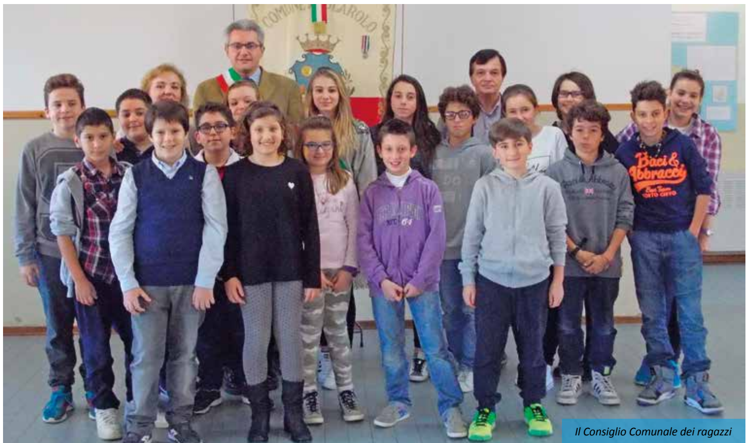
Il Consiglio Comunale dei ragazzi