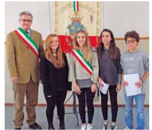
La Giunta Comunale dei ragazzi