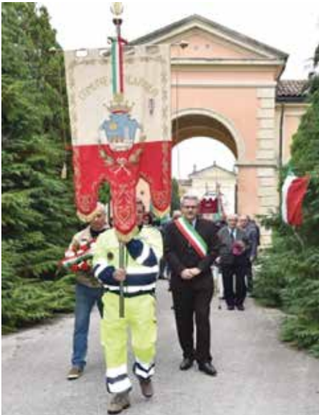
Parte il corteo al Cimitero della Madonna della Salute

"Onori" a tutti i combattenti caduti, nel 71° del sacrificio del Partigiano "Tigre"